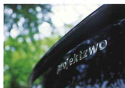
おとなしめのリアウイングは¥45,000。リアスタイルはオーソドックスな手法でチューニング

デルをベースにしたフル装備車。少しスポーティ感に欠けるボラも、プロジェクトツヴォーの手にかかるとスポーティに、そして迫力あるフォルムに変身する。だが、ボラ本来のエレガントさも失われていないところは手慣れた感じがする。予算に応じて好みのパーツを選んで装着することもできる。