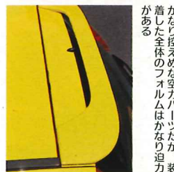
かなり控えめな空力パーツだが、装着した全体のフォルムはかなり迫力がある