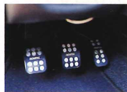
シルバーとブラックのツー-toneで仕上げられたアルミ製ペダルが装備される。デザインも優れている

走り、不満は出てこないはず。最も特徴的な部分は、やはりアバルト・モデルとはひと味違ったエクステリア。フロント、サイド、そしてリアにスポイラーなどの空力パーツが与えられる。また、サスペンション、ブレーキなどにも手が入り、スポーツ性能は確実に向上している。