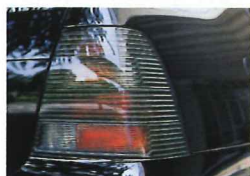
ランプ系のチューニングでは欠かせないブラックテールランプもしっかりと装備されている