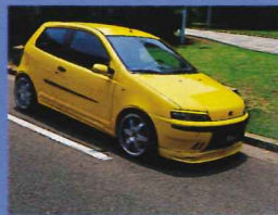
シャープな印象が強くなったフロントマスク

問い合わせ/ノビテック・ジャパン http://www.novitec.co.jp