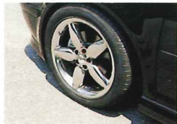
オリジナルのホイール(¥93,000・1本)がスタイリングを引き締めている。ローダウンのスプリングも装備