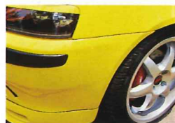
フレンド社のフレキシシステムに17インチホイールなど、走りの機能も十分な性能アップが図られている